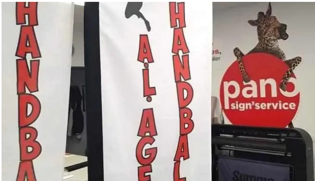
Pano passage d'agen le interieur