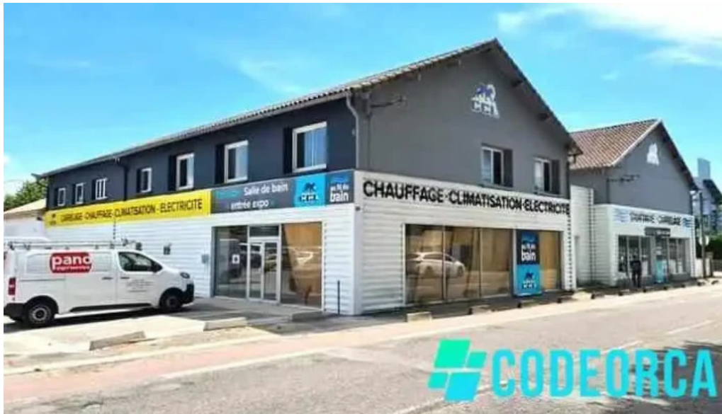
Pano passage dagen le tout