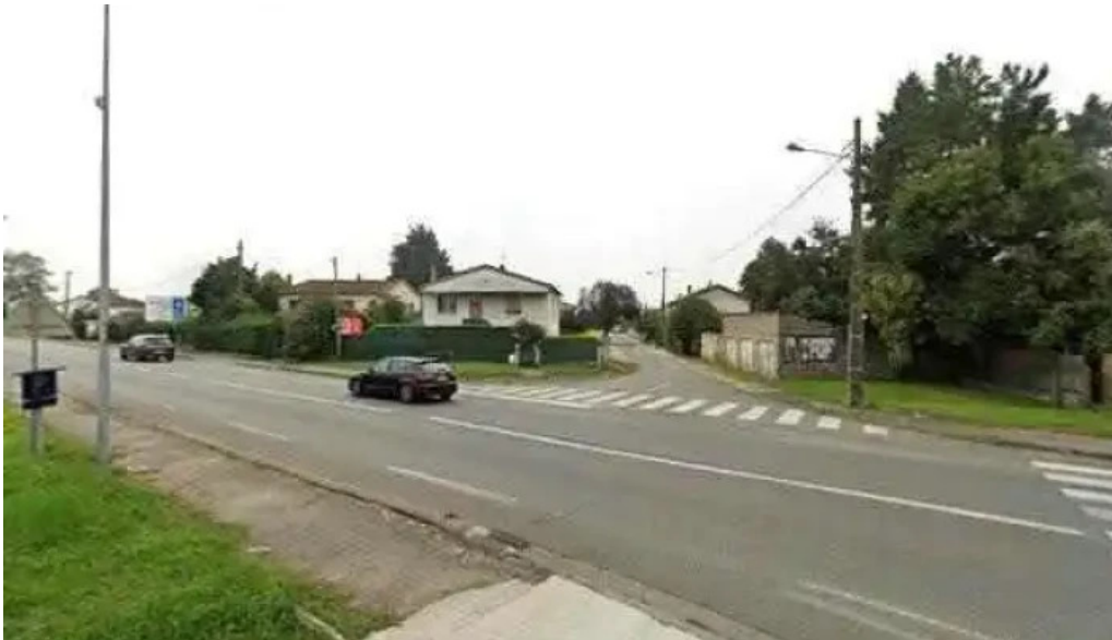
Pano passage dagen le street view et 360deg