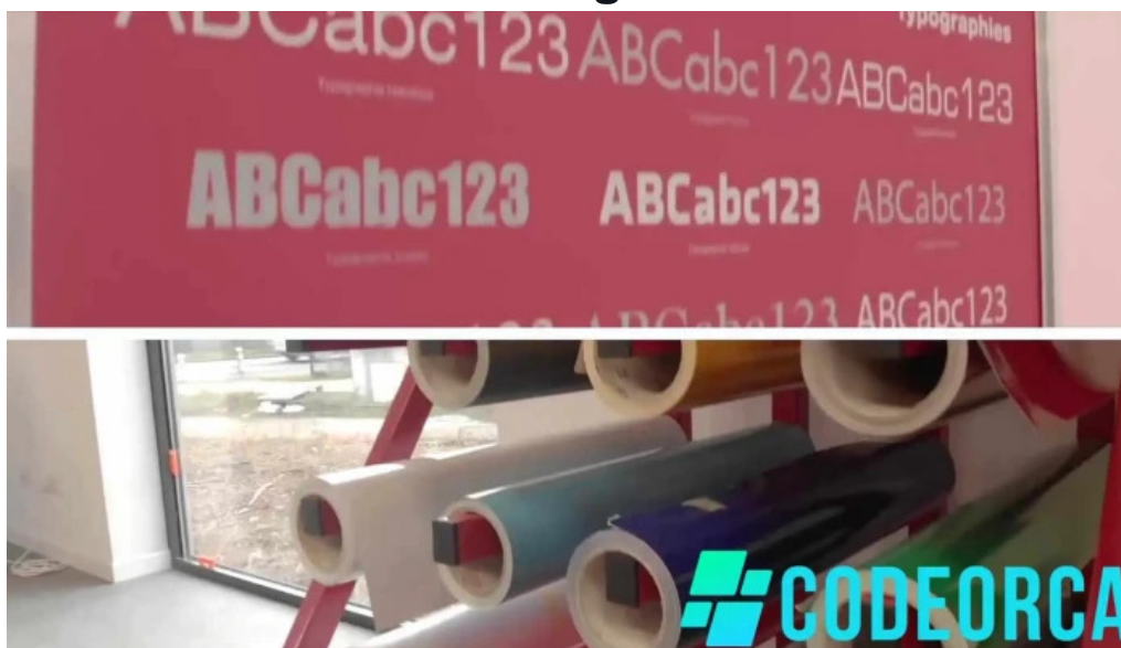
Pano passage dagen le videos