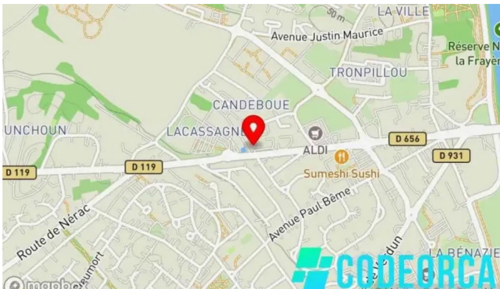
Pano passage d'agen le carte