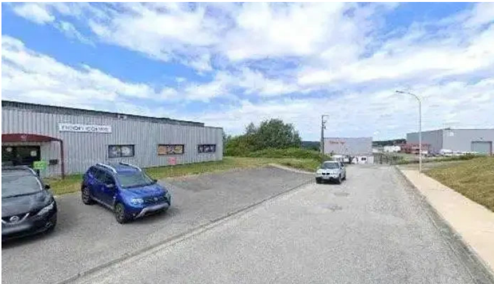
Neon centre street view et 360deg