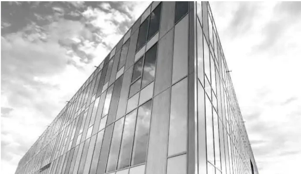
Com sud boe