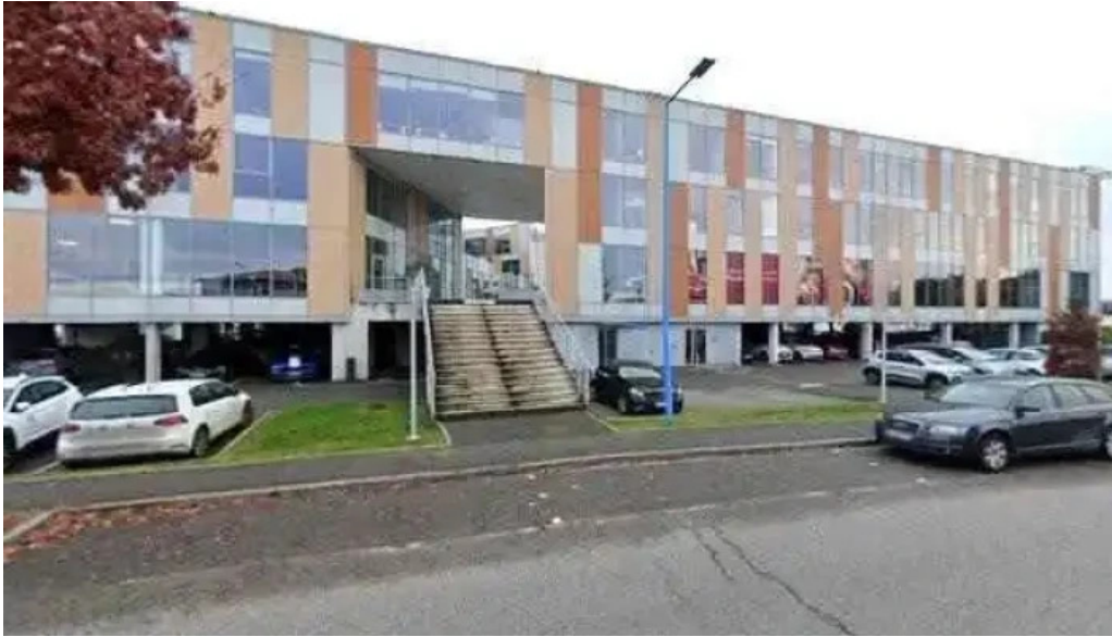
Comsud street view et 360deg